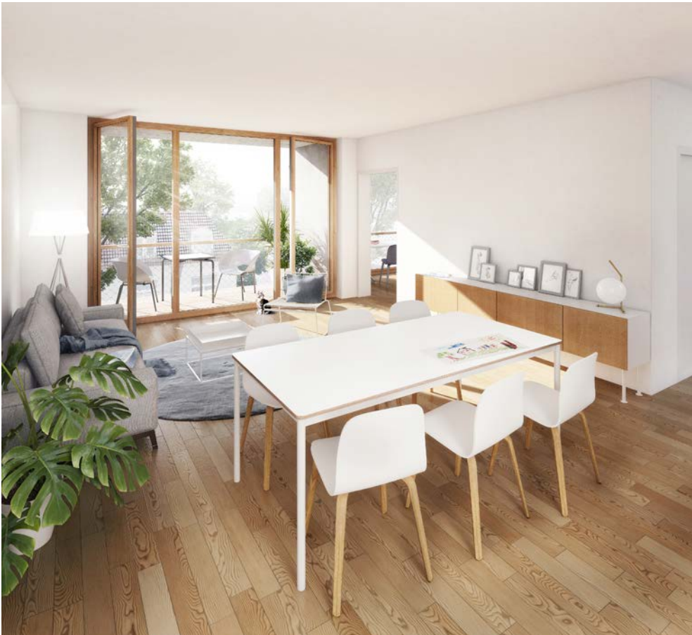
Visualisierung Innenraum 4-Zimmer-Wohnung

Alle Wohnungen verfügen über eine Loggia oder Terrasse, sowie eine gehobene Ausstattung mit Fußbodenheizung in allen Räumen. Im Kellergeschoss stehen Abstellräume, PKW- und Fahrradstellplätze zur Verfügung.