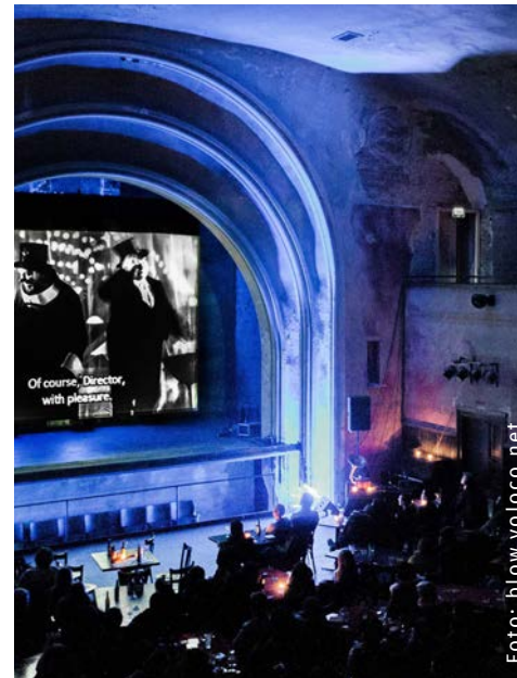
Das Stummfilmkino Delphi