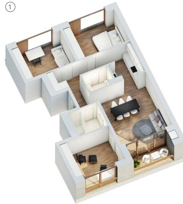
Haus 1 - Vorderhaus Regelgrundriss 4 Zimmer ca. 95 qm