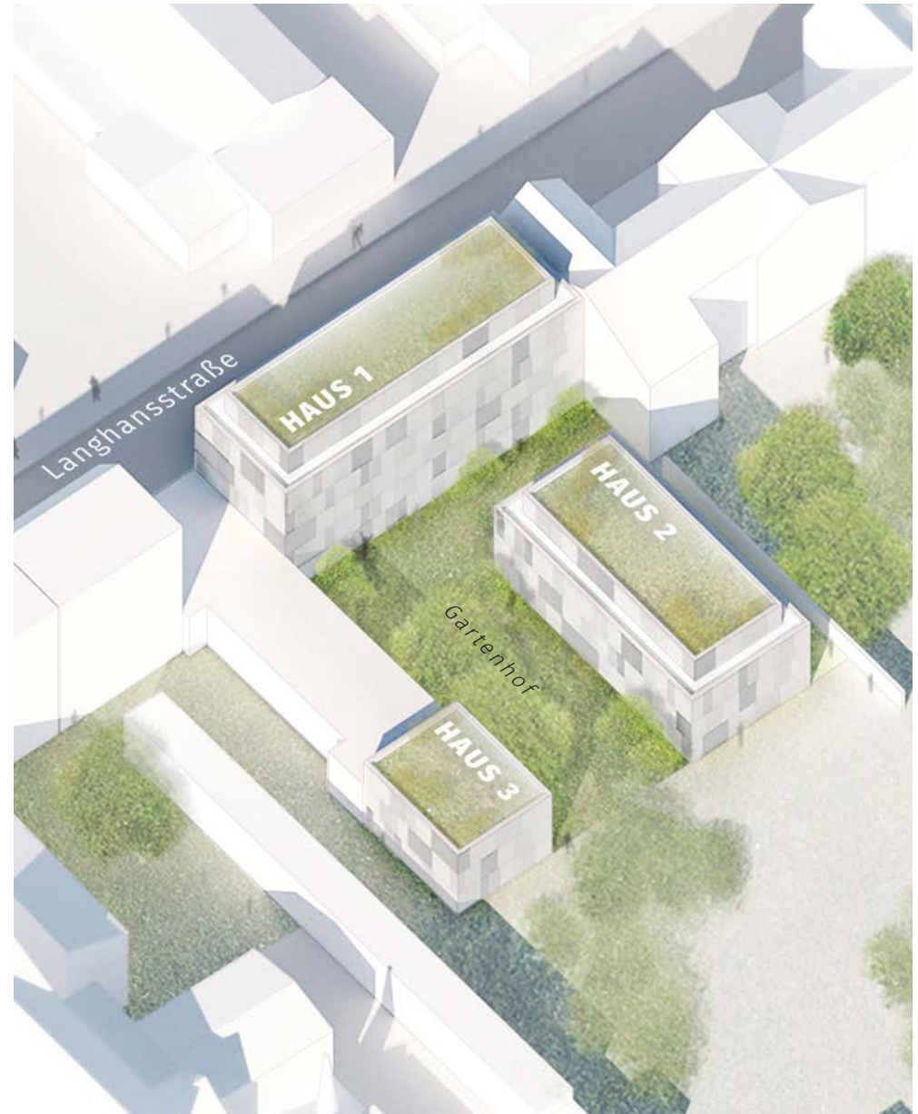
Vogelperspektive des Bauvorhabens Langhansstraße 24 in Weißensee, Planungsstand: 03|2018*

Es entstehen 47 Eigentumswohnungen und zwei Gewerbeeinheiten in drei Gebäuden zwischen drei und sechs Geschossen – ein entspannter Rückzugsort mit viel Sonne, Luft und Grün mitten in der Stadt!