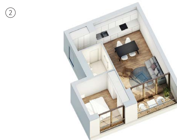
Haus 2 - Gartenhaus Regelgrundriss 2 Zimmer ca. 43 qm